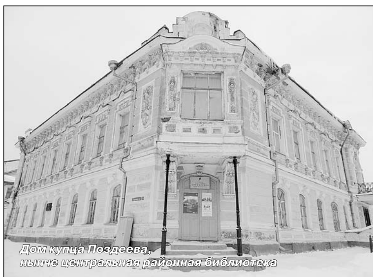
Дом купца Поздеева, ныне центральная районная библиотека