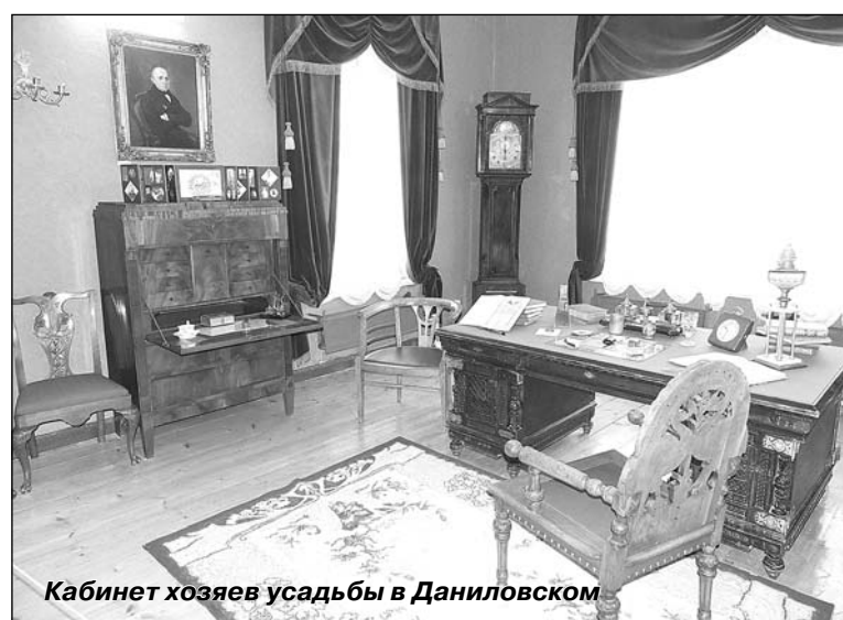
Кабинет хозяев усадьбы в Даниловском

тью в Даниловское, я приведу здесь слова из брошюры А. В. Боброва, изданной в 1963-м году Вологодским книжным издательством - «Народный музей в Даниловском»: «В пятнадцати километрах от Устюжны на высоком угоре разме-