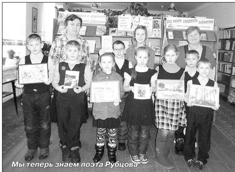
Мы теперь знаем поэта Рубцова

речецов. Ребята внимательно слушали ее выступления.