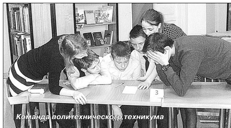
Команда политехнического техникума