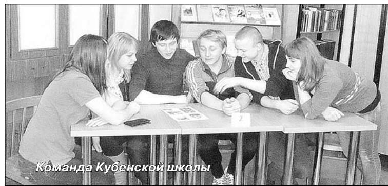
Команда Кубенской школы