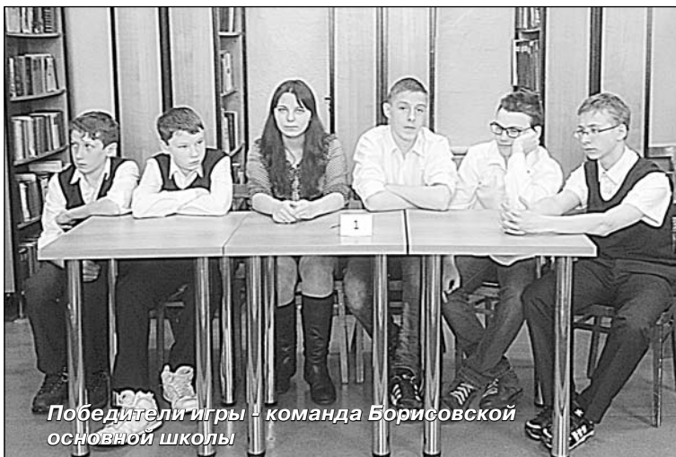
Победители игры - команда Борисовской основной школы

На литературную игру «Спасибо, русский огонёк!», посвящённую жизни и творчеству Н. М. Рубцова, собрались в читальном зале Вологодской центральной районной библиотеки с. Кубенского 17 марта команды Борисовской, Фетининской, Кубенской школ и Вологодского политехнического техникума.