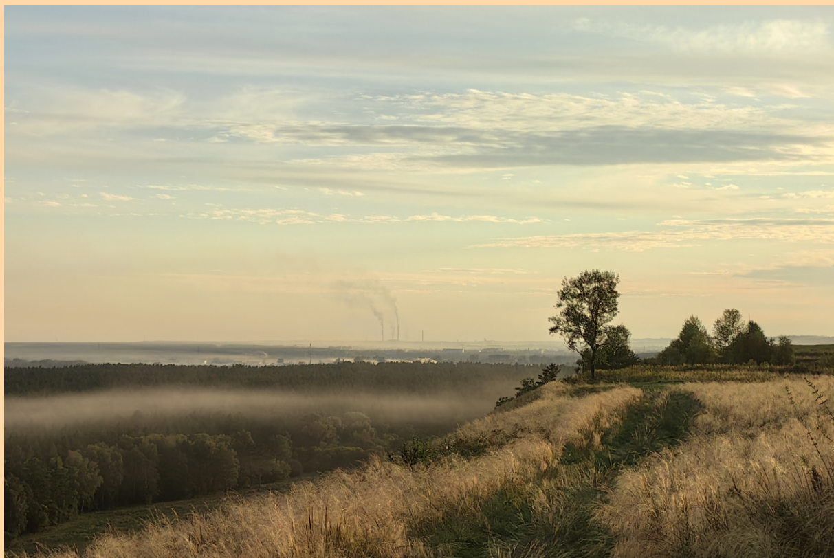
Утро на Солтонском тракте. Окрестности Бийска