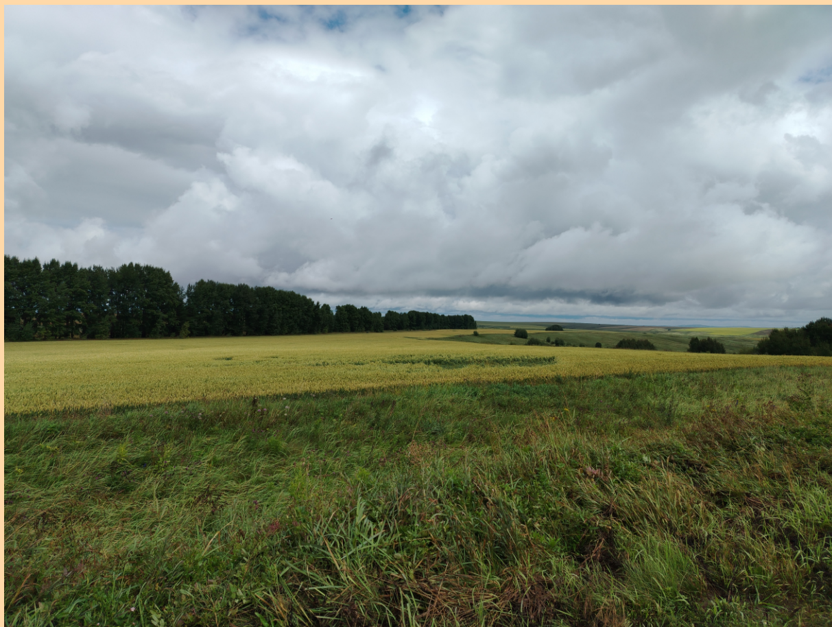
Алтайские поля, окрестности села Овсянниково.